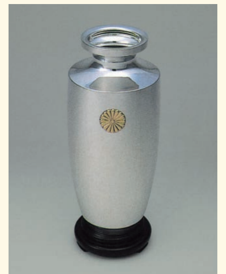
賜品「御紋付銀花瓶」(第34回まで)